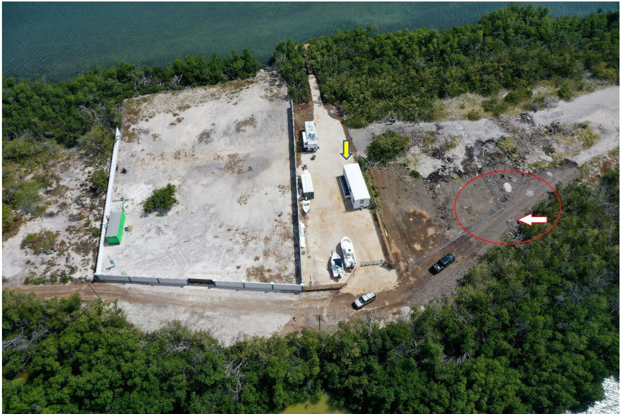
Área B. vista noreste.